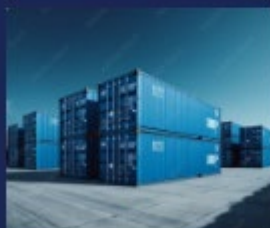
パレット / コンテナ / 保管機器