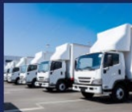
産業 / 運搬車両