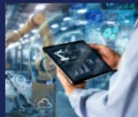
ソフトウェア / IoT / AI