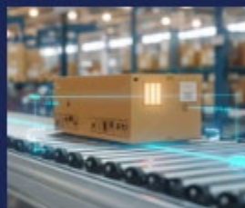
梱包 / 包装システム