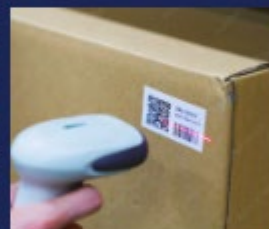
搬送 / 仕分け / ピッキング