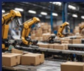
倉庫内作業効率化