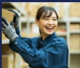
物流業務改善支援