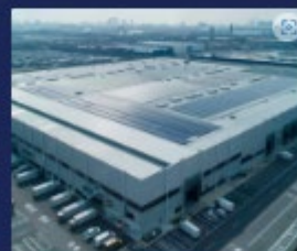
物流拠点 / 物流施設開発